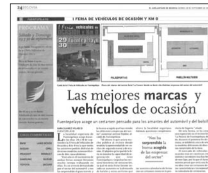
Especial publicado en El Adelantado de Segovia el 28 de septiembre de 2007

Además, debido a la importancia y a la peculiaridad de esta exposición única en Segovia, los medios de comunicación hacen reportajes y seguimientos de lo que ocurre durante los días de Feria en Fuentepelayo.